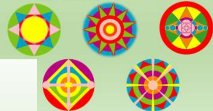
Snel Herstel Spray