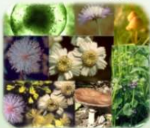
Immuun Vitaal Support Spray